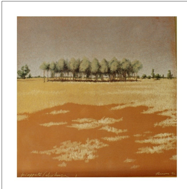
Pioppeto (distanze) , 1997, pastelli ceramici, cm 40x40.

Nel senso di una stretta gestione delle risorse e pensando all'uomo come elemento perturbatore/modificatore degli equilibri naturali, ma anche come fattore essenziale di riequilibrio/creatività,