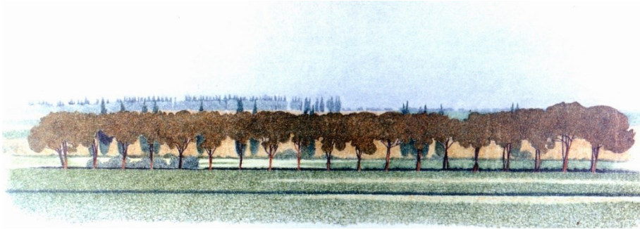
Pini a La Noria , 1995, pastelli ceramici, cm 65x25.

Le parole e le cose dunque, oltre che gli spazi. Lo sguardo, oltre che la necessità di abitare lo spazio. Nella ricordata valutazione che l'uomo fa delle sue cose, mentre le osserva, nelle infinite 'geografie dello sguardo' 4 forse è davvero inevitabile aver coscienza di confluire e muoversi tutti nella medesima scena planetaria come nelle infinite scene locali: dobbiamo ad Eugenio Turri 5 la recente ed efficace