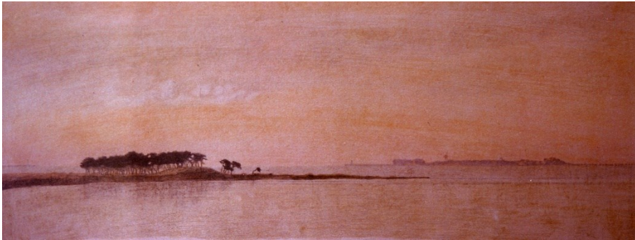
La Punta del Canto. Alba su P. Rondinella, 1995, pastelli ceramici, cm 65x25.

spesso di smarrimento di una identità in un passato recente troppo autoreferenziale, la cultura urbanistica italiana può e deve ritrovare fisionomia e contenuti con la massima apertura possibile e certo senza obliterare quanto di meglio essa ha prodotto, e non è poco, in periodi meno vicini all'oggi e troppo volentieri lasciato nell'oblio della storia.