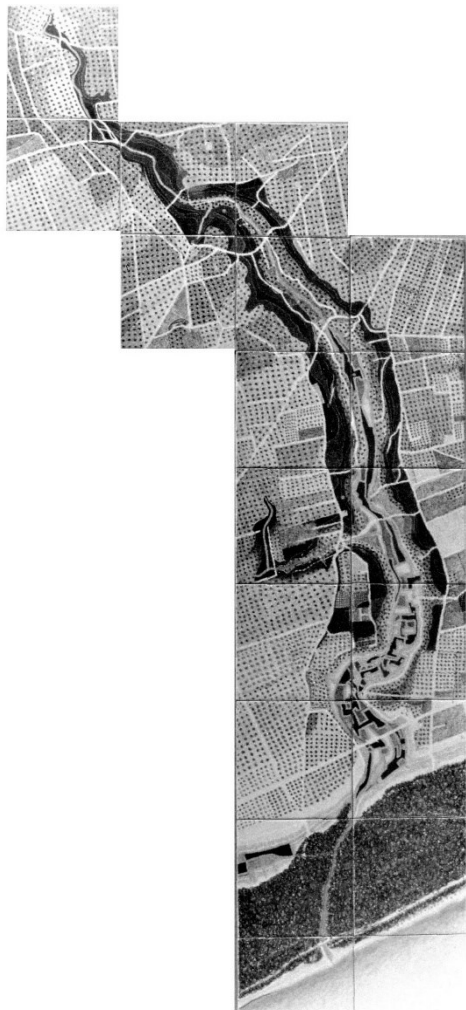
R. Perrone, Lama di Lenne , 1994, pastelli ceramici, cm 60x135.

Secondo elemento-risorsa dopo la spiaggia è, infatti, ancora più a monte, la pineta. Anzi le pinete. E qui è d'obbligo il riferimento agli incendi. Anche di questa vera e propria emergenza si fa un gran parlare ma non si affronta alla radice il fenomeno che, con il conforto statistico, ha per gran parte origine dolosa, anche rispetto alle rivendicazioni degli stessi addetti stagionali del settore. Questo tutti lo sanno ma chi può intervenire non incoraggia alcuna iniziativa adeguata. Tralasciamo poi la recente evoluzione delle cause degli incendi dolosi dovute al rancore per la perdita potenziale speculativa dei boschi, grazie a norme più aggiornate, e per chi a quelle speculazioni ci crede ancora, specialmente quando tali fenomeni si manifestano in occasione di azioni e iniziative per la tutela del bosco 4 .