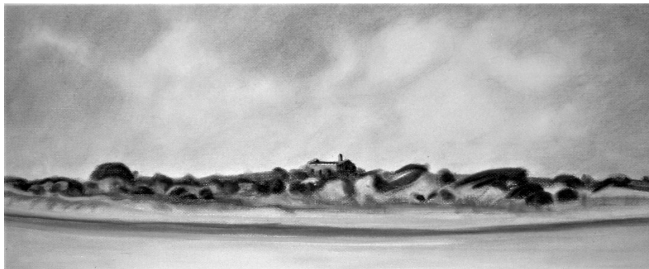
R. Perrone, Dune alla foce del Lato , 1995, Pastello su carta, cm 70x30.

quelli che sono veramente la sostanza costitutiva del territorio italiano. Esattamente come si fece con le bonifiche e poi con le trasformazioni fondiari della Riforma agraria.