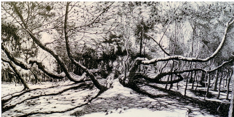
R. Perrone, La pineta dopo la pulizia , 1, 1997, china su carta, cm 35x15

In definitiva, si può affermare che gli itinerari potevamo inventarli noi già dieci anni fa prima dell'onorevole Signorile, e non dietro uno stimolo tardivo di una legge ma come risultato naturale di un dinamismo economico-culturale locale, per quanto viziato da uno spontaneismo che, purtroppo, ha un facile effetto di contagio.